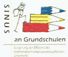
Sinus an Grundschulen: Tanja Niss

Wir danken den Grundschulen Hainholz und Moorrege für die Ausrichtung der Kreisrunde. Außerdem danken wir der Sparkasse Südholstein und der Sparkasse Elmshorn für finanzielle Unterstützungen, die die Ausrichtung erst möglich machten.